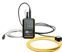
Adapter ERP-1 z cęgami elastycznymi FS-2 i futerałem WAADAERP1V2