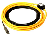
Cęgi elastyczne FS-2 (fi 1260 mm), poziom wyjścia 100 mV / 1 A WACEGFS20KR