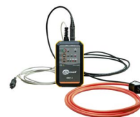
Adapter ERP-1 z cęgami elastycznymi FSX-3 i futerałem WAADAERP1V3