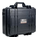
Walizka twarda XL8 WAWALXL8