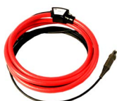
Cęgi elastyczne FSX-3 (fi 630 mm), poziom wyjścia 300 mV / 1 A WACEGFSX30KR