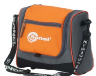
Futerał na adapter M6 WAFUTM6